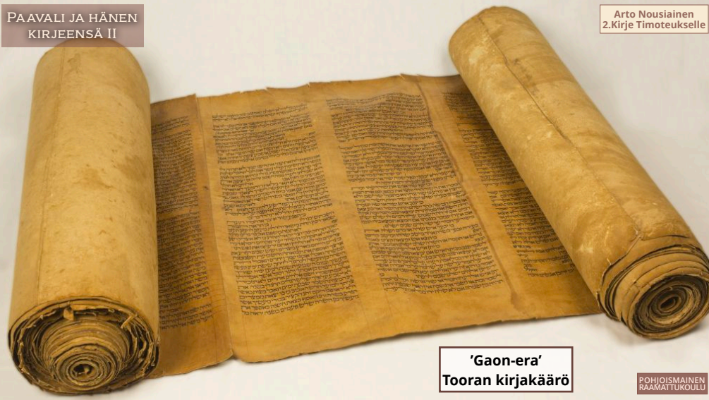
'Gaon-era' Tooran kirjakäärö