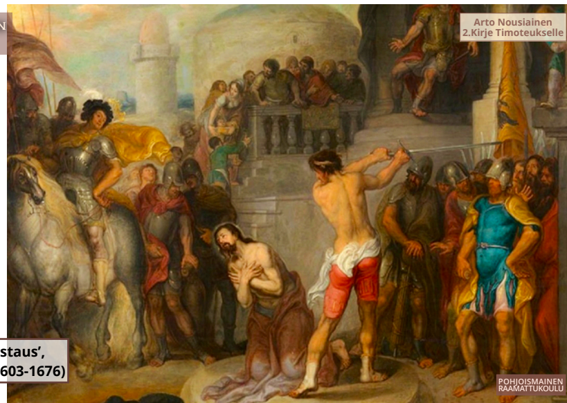
'Paavalin mestaus', Simon de Vos (1603-1676)