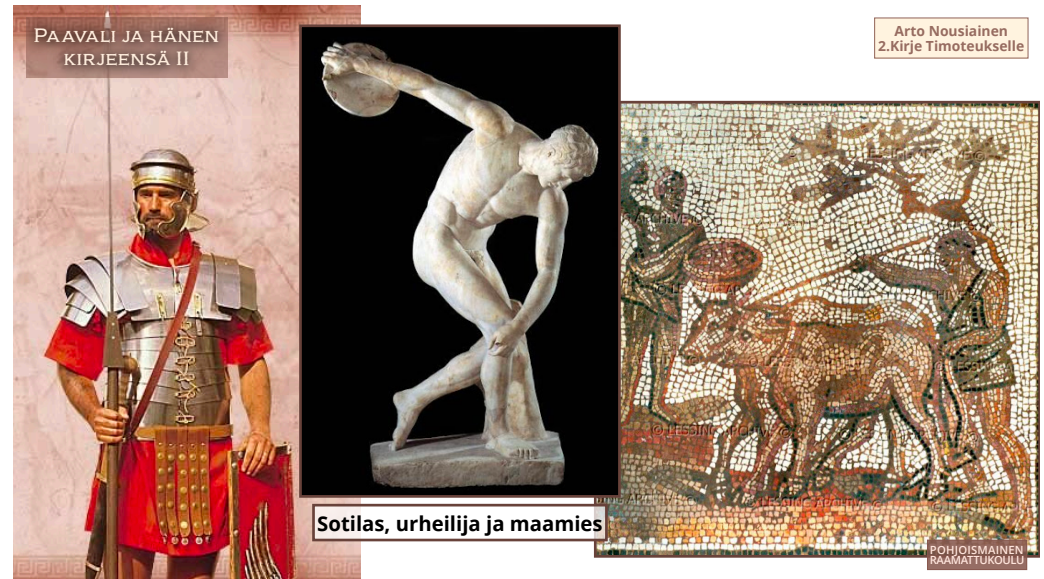
Sotilas, urheilija ja maamies